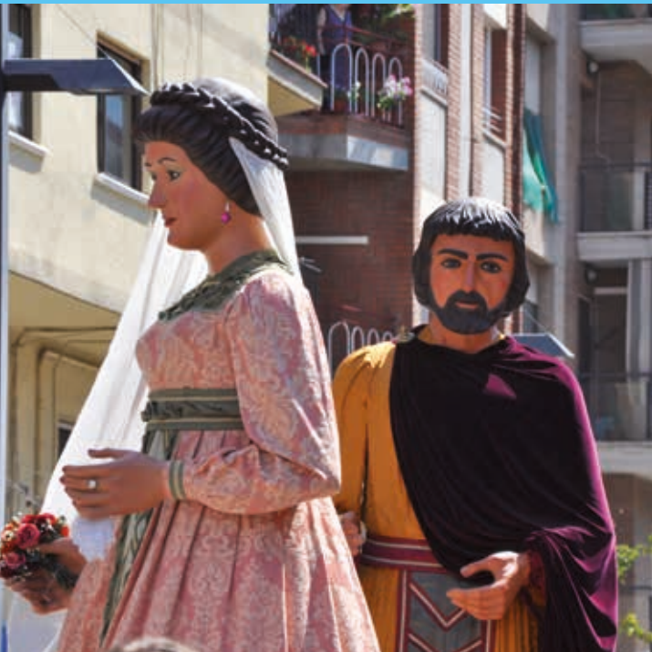
El Pere i l’Elisenda tornaran a ballar aquesta Festa Major