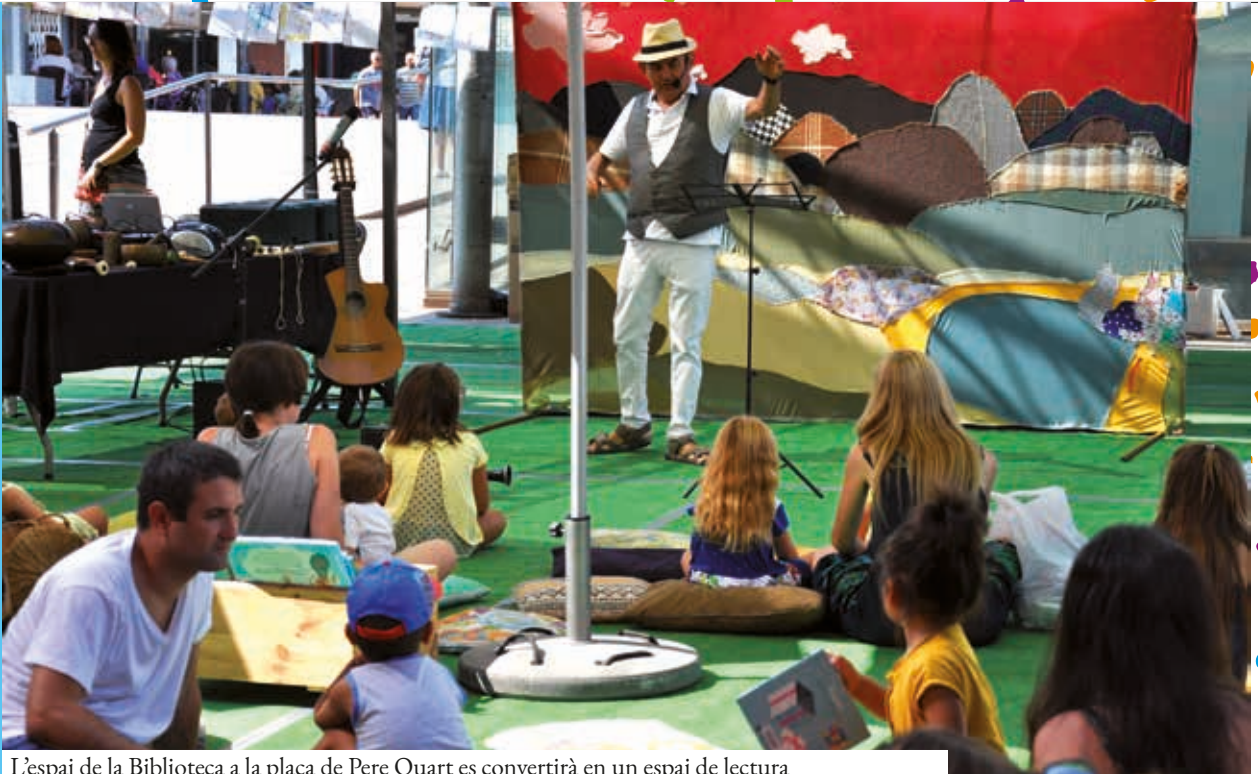
L'espai de la Biblioteca a la plaça de Pere Quart es convertirà en un espai de lectura