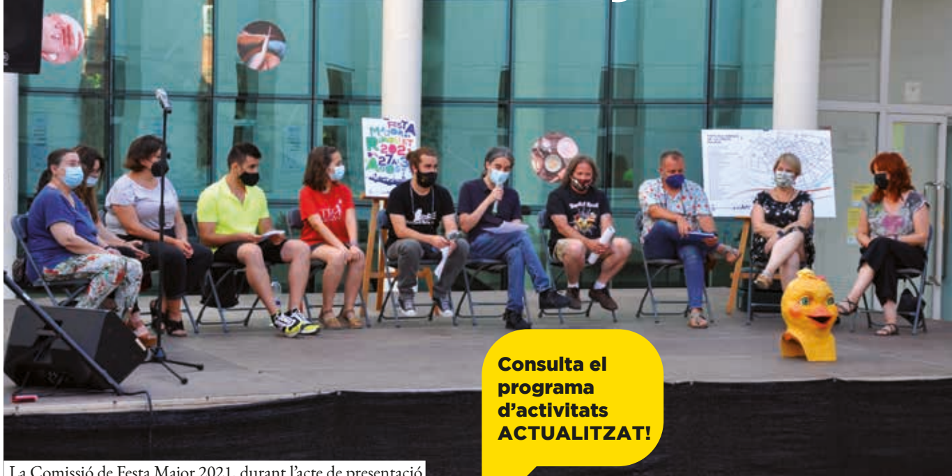
La Comissió de Festa Major 2021, durant l'acte de presentació

Consulta el programa d'activitats ACTUALITZAT!