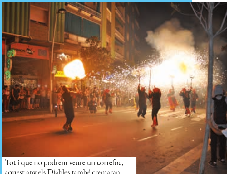
Tot i que no podrem veure un correfoc, aquest any els Diablos també cremaran