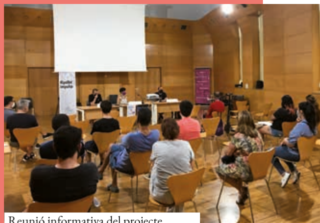
Reunió informativa del projecte

Les actuacions aniran enfocades a contribuir a la millora de les condicions d'escolarització i a l'èxit acadèmic; a potenciar l'educació en valors, el compromís cívic i la participació dels alumnes en espais de lleure; a potenciar la implicació de les famílies; a millorar la presència i l'ús social de la llengua catalana, i a potenciar el treball en xarxa de tots els agents educatius del territori.