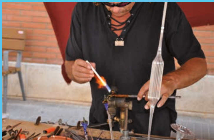
El Mercat de la Vinya tornarà a donar protagonisme a l'artesania

Enguany la reivindicació d'aquest Mercat de la Vinya és, a més de reivindicar el passat vitivinícola de Ripollet i el seu valor, fer una aposta gastronòmica de qualitat i proximitat, incorporant-hi restauradors i artesans locals per mostrar el potencial que té la vila. S'ha buscat un equilibri d'activitats atractives per a tots els públics, un fet afavorit per la intergeneracionalitat de la subcomissió de la vinya dins la Comissió de la Festa Major. Un relat que engloba tradició, innovació, patrimoni i festa al voltant de la vinya a Ripollet.