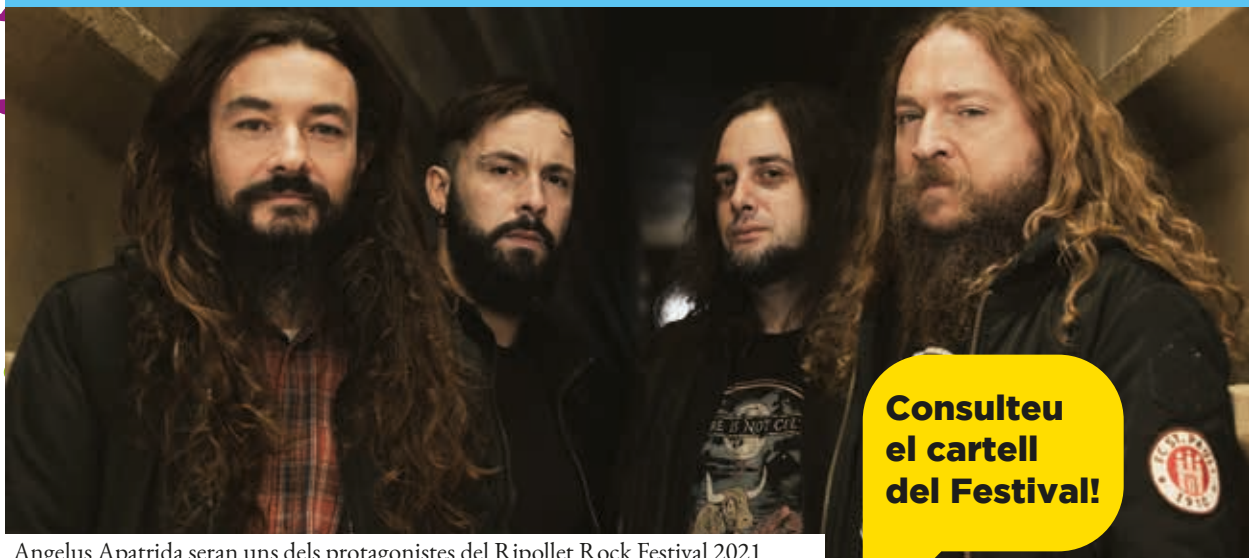
Angelus Apatrida seran uns dels protagonistes del Ripollet Rock Festival 2021