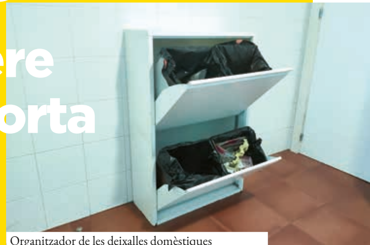
Organitzador de les deixalles domèstiques

Però a banda dels avantatges mediambientals, en tenim d'altres importants. Per exemple, deixarem enrere els desbordaments i males olors que ens trobem sovint al voltant dels contenidors; desapareixeran els punts d'abocament incontrolats de mobles i trastos vells, i no ens haurem de desplaçar fins als contenidors. Així, amb el porta a porta es vol aconseguir uns